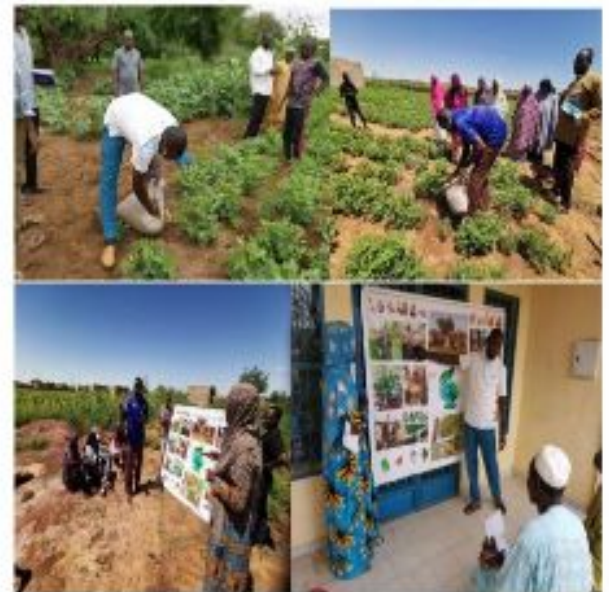
Figure 7: Sensibilisation et entretiens des paysan-nnes sur l'intérêt du Bokashi

Le programme 2SCALE est conçu pour incuber et accélérer le développement de modèles d'affaires inclusifs dans les systèmes agroalimentaires africains. 2SCALE est cofinancé par le Ministère néerlandais des Affaires étrangères par l'intermédiaire de la Direction générale de la Coopération internationale (DGIS). Essentiellement basé sur l'entretien de la fertilité des sols et de l'autonomie des producteurs à travers l'auto-production de l'engrais organique " Bokashi " dans les exploitations agricoles nigériennes réputées très pauvres en certains éléments nutritifs essentiels aux plantes. Cette mission avec une durée a permis de sillonner 19 localités des régions de Maradi, Tahoua et Dosso.