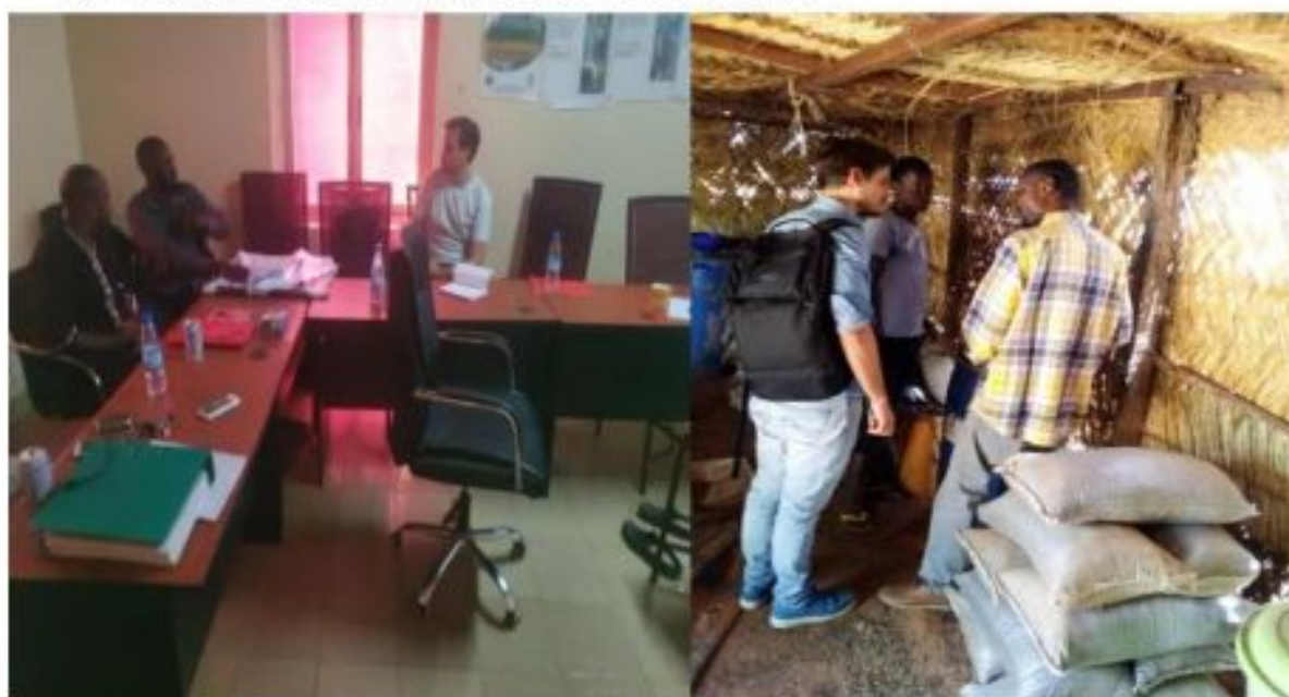
Figure 29: Mission de travail de SOS FAIM auprès de FASAM Terre Verte