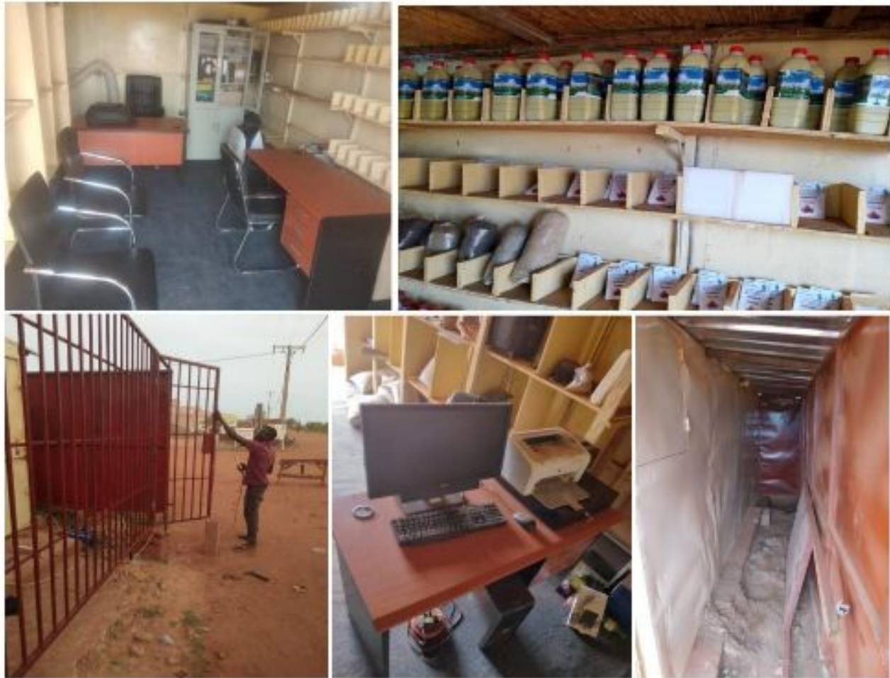
Figure 16: Réfection de la Boutique de Ventes de FASAM