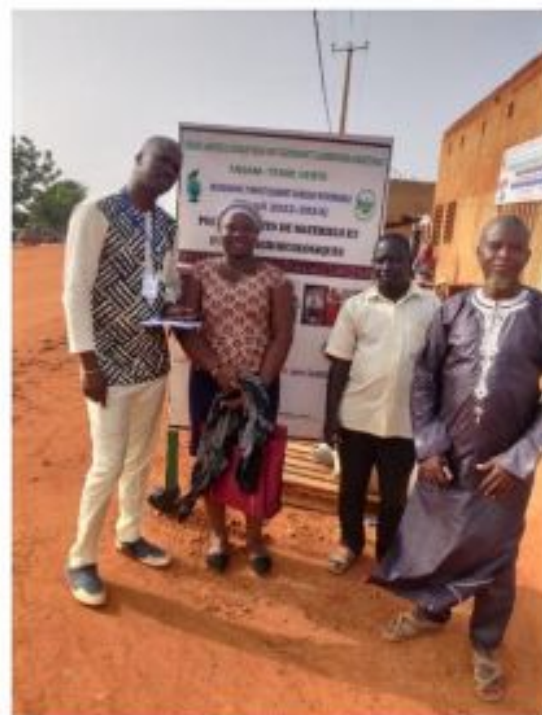
Figure 31: Equipe de Consultants auprès des commerciaux de FASAM

L'objectif principal poursuivi est d'élaborer pour la coopérative FASAM Terre Verte un document de stratégie pour le développement de la commercialisation de produits issus de l'agriculture. Pour ce faire, la coopérative FASAM a fait recours à une expertise externe pour questionner le modèle classique de ventes de la coopérative et aider à définir un plan marketing. Ce processus entamé en octobre 2022, n'est pas clos (rapport final reste provisoire et nécessite des améliorations). On a observé un retour tardif du consultant par rapport aux documents attendus. Cependant, il a permis de procéder au diagnostic du système commercial de la coopérative et de mettre en lumière les imperfections sur différents plans (positionnement, présentation des produits, communication sur les plateformes). Le rapport de diagnostic synoptique de l'approche commerciale de FASAM révèle que ce derniers au regard des actions, ne dispose pas de stratégie marketing et communicationnelle de poursuite de ses objectifs socio-économiques. En ce sens, ce travail pour définir à l'avance des actions commerciales bien structurées va se poursuivre en année 2023.