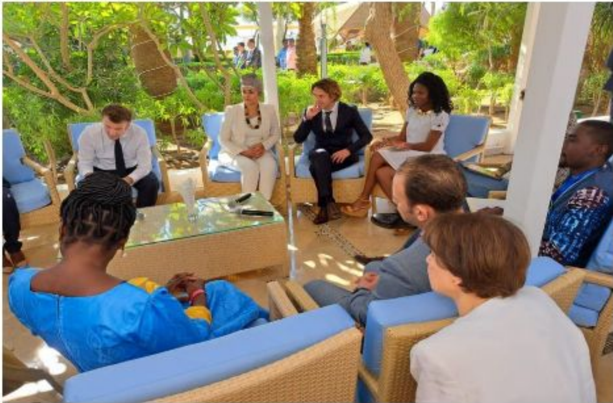
Figure 6: Séance de travail du PR E. Macron avec la Jeunesse Africaine et Française

grâce au partenariat avec l'Ambassade de France au Niger dans le but d'appréhender le climat des négociations climatiques impactant le monde rurale, de porter des échanges auprès des décideurs, de découvrir (renforcement de capacités) et de plaider pour des initiatives durables. La COP27 est organisée sous la présidence égyptienne avec mantra « Together for implementation. » Ce thème a été choisi pour rappeler l'importance des actions collégiales de mise en œuvre des décisions. En marge de cet évènement mondial, d'importantes rencontres de haut niveau avec la Délégation et autorités Françaises ont été initiées. Ainsi, le lundi 07 Novembre 2022, le Chef de l'Etat français a reçu le groupe de jeunes africains et français pour échanger autour de la perception du partenariat Afrique-France et de la conduite globale des négociations climatiques. Il s'est agi d'une interviewe retransmise en direct par la presse dans une atmosphère d'écoutes mutuelles. https://www.youtube.com/watch?v=QSUFS4I4MDk