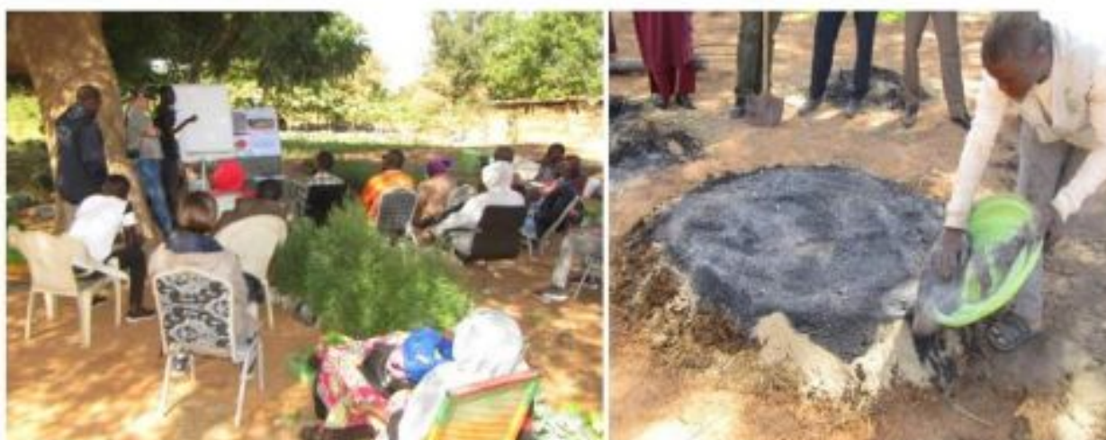
Figure 2: Séance de formation sur la production du Bokashi

Dans le cadre de son programme FASAN (Formation Agricole pour une Souveraineté Alimentaire au Niger), la coopérative FASAM a organisé une formation sur les techniques de fabrication et d'utilisation de l'engrais organique le Bokashi à l'endroit des agriculteurs. Cette formation étalée sur une journée a bénéficié de l'appui technique du RECA en présence du partenaire SOS Faim Luxembourg en mission au Niger courant janvier 2022. Ainsi, quatorze (14) producteurs ont souscrit à la formation et bénéficié de cette séance de sensibilisation sur la fragilité des sols agricoles et des possibilités de maintenir, entretenir la fertilité des sols. L'essentiel des participants étant des producteurs ruraux, ces derniers ont répliqué la formation à leurs pairs et avaient partagé des photos de ces séances de formations de paysans à paysans. Il s'agit d'une première série de formation prévue dans le cadre des activités définies en 2022.