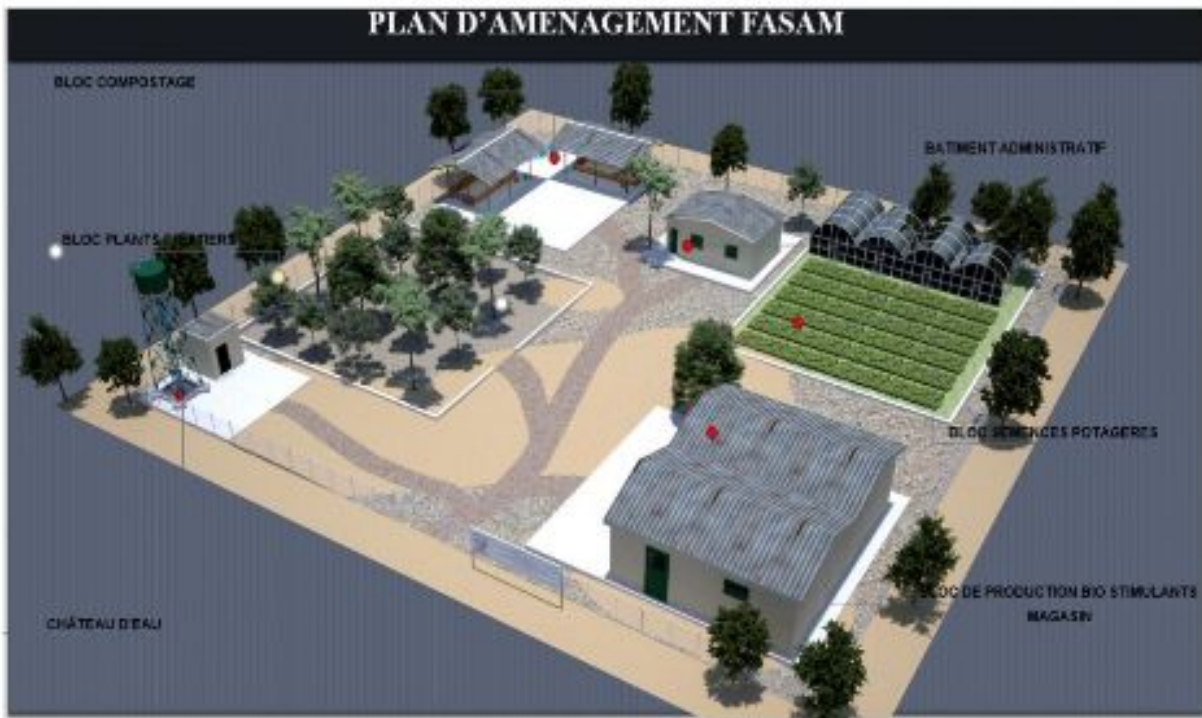
Figure 12: Maquette de la Ferme FASAM