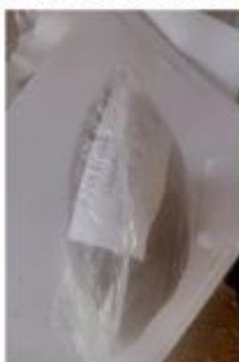
Echantillonnage de compost + PNT