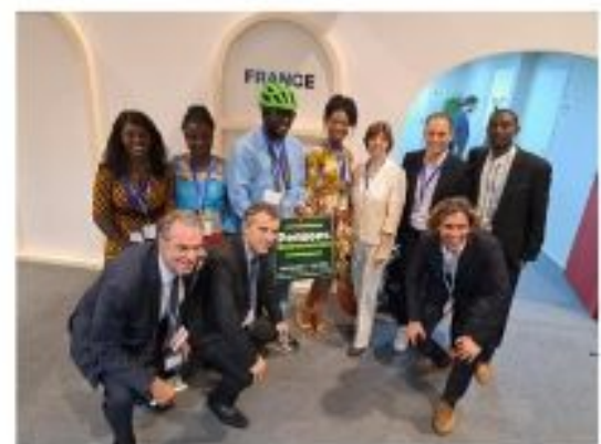
Figure 7 : Groupe de Jeunes africains et français reçu par la Ministre de l'Europe

Ces échanges ministériels avaient permis d'un point de vue opérationnel d'approfondir les réflexions sur des mécanismes de mise en œuvre d'initiatives et de suivi des