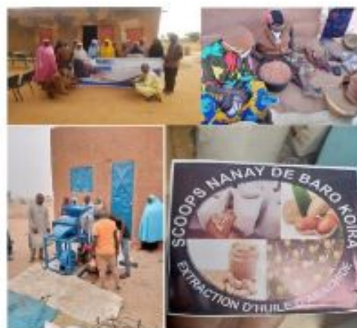
Figure 5: Operations de diagnostics de la SCOOPS NANAY

Cette initiative a consisté à l'aménagement d'un jardin potager et d'une formation à la matière portée par l'équipe FASAM. Les formations suivies par 36 femmes urbaines ont porté sur :