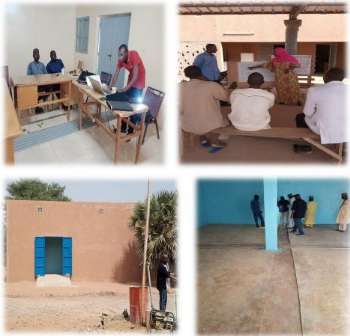
Figure 10: Sessions de travail et visite commentée du Magasin de Tibiri d'une capacité de 100 Tonnes du RPPT/D

régions d'Agadez, Tahoua et Tillabéry, fut effective du 17 au 22 Octobre 2022 dans la commune de Doutchi, région de Dosso. Elle a mobilisé le Comité de Gestion du RPPT/D, des membres et techniciens ayant permis de cerner le fonctionnement de cette organisation porteuse du Concept économique de la pomme de terre, ses difficultés et défis ainsi que les multiples services qu'elle assure à ses membres dans une économie locale rythmée par les filières maraîchères (avec tête de peloton : la pomme de terre).