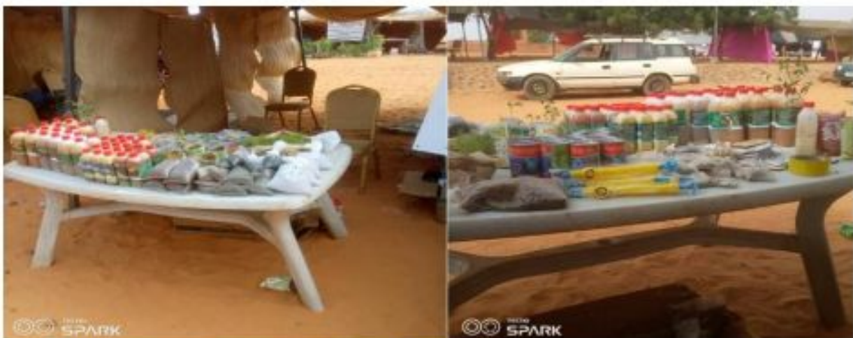
Figure 19: Exposition vente de foire Agroécologique de Margoubene

Cette foire à l'initiative de l'ONG SWISSAID (membre de la plateforme Agroécologique Raya Karkara) fut tenue du 23 au 27 Octobre 2022 pour offrir des opportunités de ventes des intrants locaux promu par les organisations paysannes du Niger.