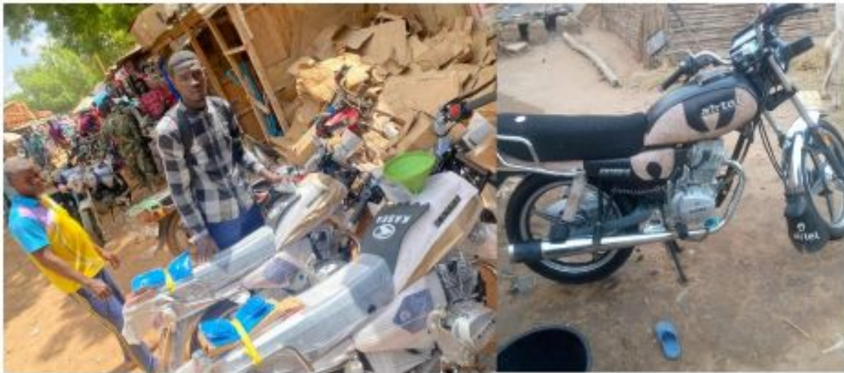
Figure 23: Trois (3) Motos des commerciaux-Partenariat SOS Faim