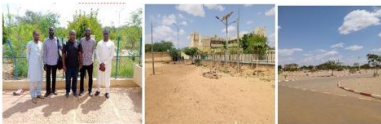
Figure 8: Equipe de diagnostics des artères et espaces urbains pour des opérations de plantation d'arbres