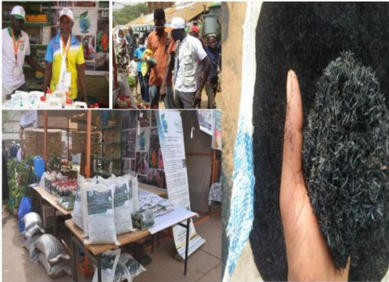
Figure 17: Participation à la Foire Agricole SAHEL 2022