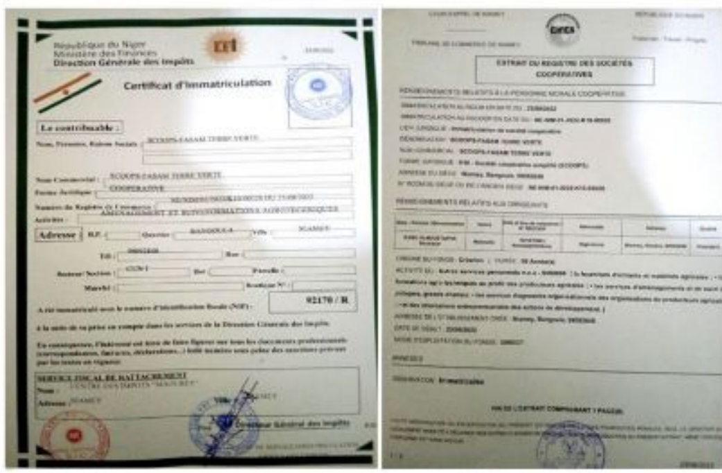
Figure 26: Certificat d'Immatriculation et Registre des Sociétés Coopératives

Ainsi, la Société Coopérative FASAM Terre Verte est identifié au Numéro d'Identification Fiscale (NIF) : 92 170 /R et le registre des Sociétés Coopératives (RESCOOP) : NE-NIM-01-2022-k10-00026. Ces documents identitaires ont permis d'acquérir une machine d'établissement de factures certifiées pour se conformer à la loi fiscale, qui exige aux entreprises de certifier les factures établies. Il s'agit d'une Unité de Facturation (UF) ELTRADE A3.