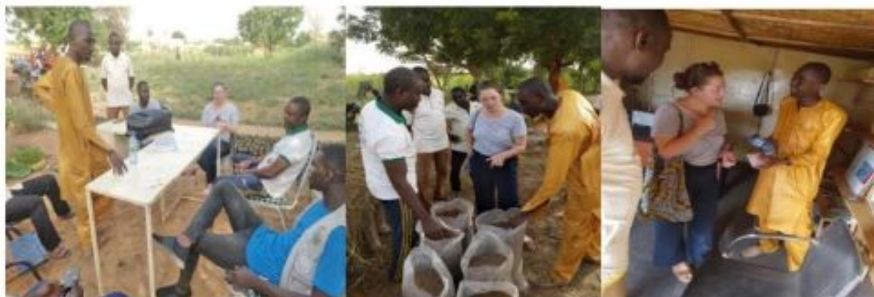
Figure 11: Visite d'échanges de l'Ambassade de France au Niger

locaux, l'Ambassade France au Niger a rendu visite à FASAM au niveau de ces points d'exercices (Boutique de vente, la Ferme transitoire et le nouveau siège administratif).