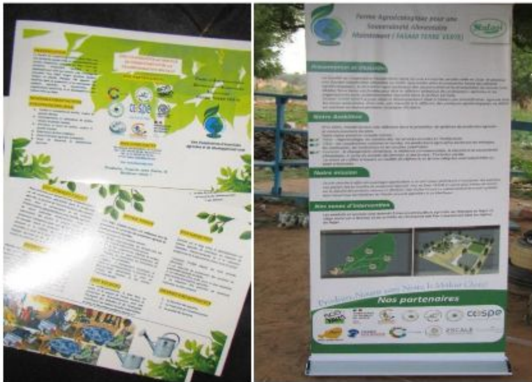
Figure 30: Supports de communication de FASAM Terre Verte