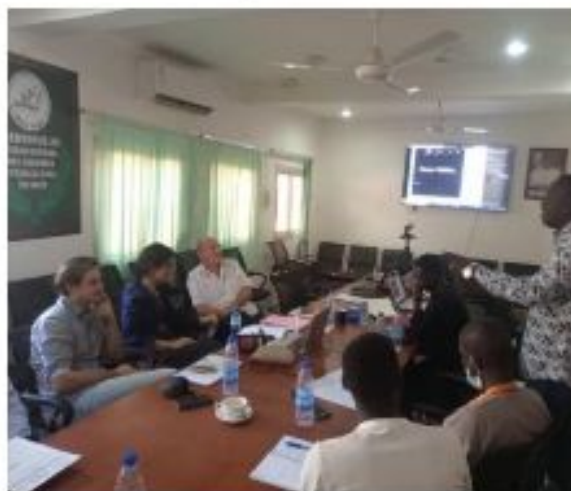
Figure 1: Atelier de présentation du Plans Stratégique au RECA

L'objectif global recherché à travers la convention de partenariat reste la mise en œuvre du plan stratégique FASAM Terre-Verte autrement dit, l'établissement d'une Ferme Agroécologique au Niger dont l'objet serait la production et diffusion d'intrants écologiques et la formation d'agriculteurs aux