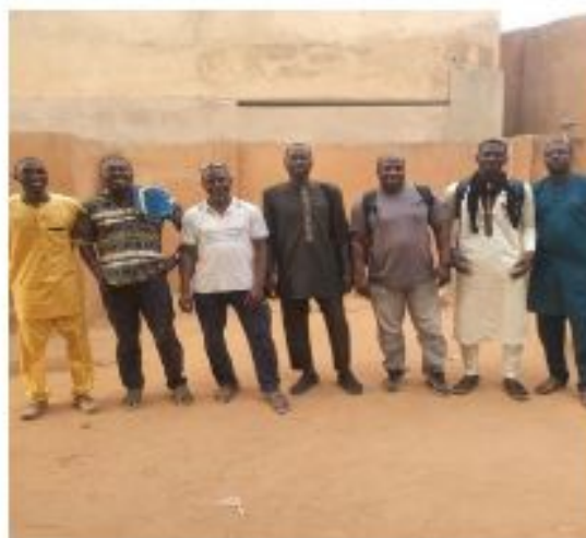
Figure 28: Image de l'AG

Les signataires des comptes bancaires de FASAM ont été désignés, il s'agit de :