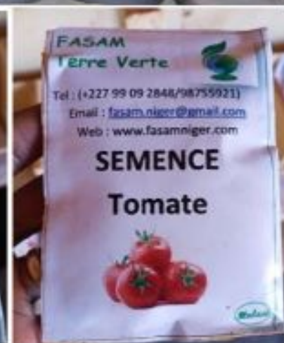
Figure 15: intrants agroécologiques (engrais, semences et bio pesticides)