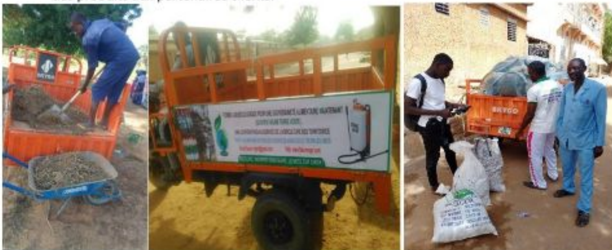
Figure 24: Visite de travail du CIPMEN

En sommes, aujourd'hui la coopérative dispose d'équipements roulants appropriés pour ses opérations agricoles et de ventes.