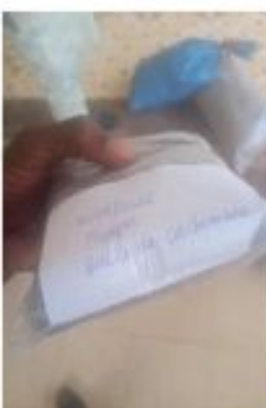
Echantillonnage de la balle de riz carbonisée

Les paramètres de la fertilité chimique déterminés sont les éléments chimiques d'intérêt nutritif pour la plante (C, N, P et K), la matière organique mais aussi le pH eau et pH KCl . Des échantillons aliquotes de 500 g ont été prélevés des sacs de 25 kg pour chaque type des produits mentionnés ci-haut. Ces échantillons ont été acheminés au laboratoire d'analyse des sols de l'INRAN pour les analyses des différents paramètres retenus. Le carbone total est déterminé par la méthode de Walkley-Black. La méthode de Kjeldahl et de Bray 1 sont utilisées pour déterminer respectivement les teneurs en azote et en phosphore total des échantillons. Le pH eau est donné par le pH-mètre.