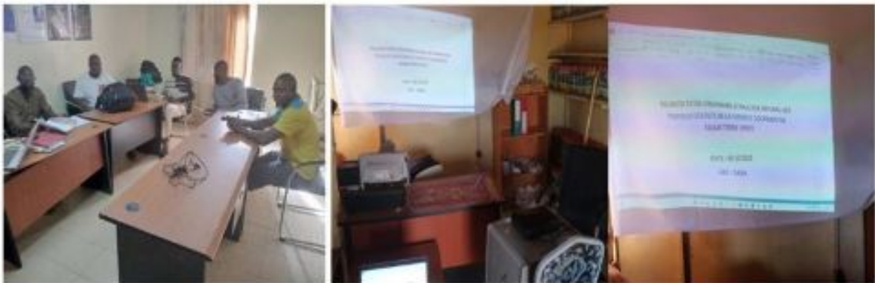
Figure 25: Session d'Assemblée Générale Extraordinaire

FASAM a demandé l'expertise technique d'une compétence juridique spécialisée dans l'accompagnement des associations et entreprises du point de vue fonctionnements administratifs et fiscalités. Ce travail abordé en fin juin 2022 a permis de produire un premier rapport de diagnostics organisationnels de FASAM. Il ressort des différentes analyses documentaires et du diagnostic de conformité au droit OHADA de la structure actuelle de FASAM TERRE VERTE, que le modèle type de société coopérative simplifiée pourra répondre aux différentes préoccupations des membres, à la seule condition que les textes réglementaires soient révisés. Sa transformation en une autre forme juridique exige des conditions préalables qui ne pourront être satisfaites avant 2 exercices (2 ans). Aussi, la SCOOP FASAM doit être identifiée auprès des services fiscaux par l'obtention d'un NIF (numéro d'identification fiscale), pour se conformer à la réglementation fiscale et prétendre bénéficier des avantages fiscaux.