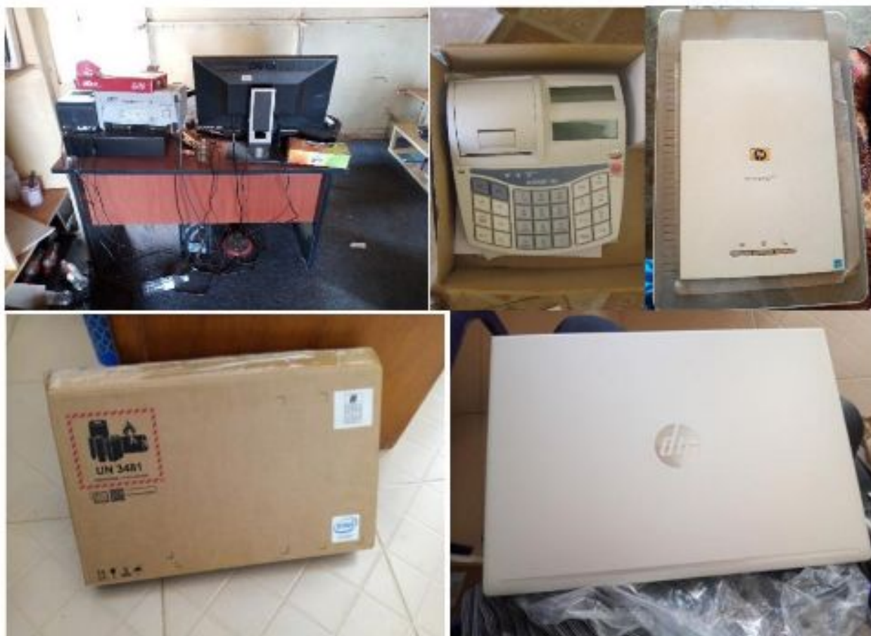
Figure 22: Caisse enregistreuse