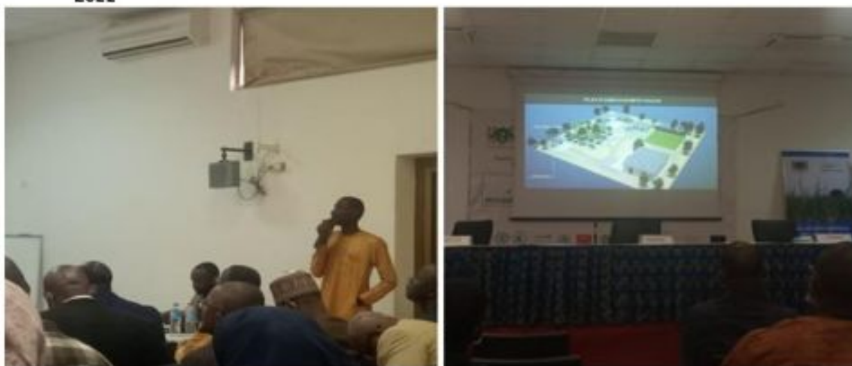
Figure 32: Communication de FASAM Terre Verte

- Participation à la COP 27 : Le Chef de l'Etat SEM E. Macron a invité des jeunes africains œuvrant dans le domaine global de la préservation des écosystèmes à rejoindre la délégation officielle française et d'échanger avec celle-ci sur les multiples initiatives entreprises et d'examiner ensemble les approches/mécanismes de collaboration et créer davantage d'impacts positifs relativement aux portefeuilles d'initiatives des agences de coopération française. Ainsi, la coopérative FASAM par le truchement de son Administrateur a participé à la 17 eme édition de la Conference Of Youth (COY) et à la 27 eme Conference Of Parties (COP 27) tenues à Charm El cheik en Egypte du 01 au 10 Novembre 2022. Cette mission de grand honneur a été effective