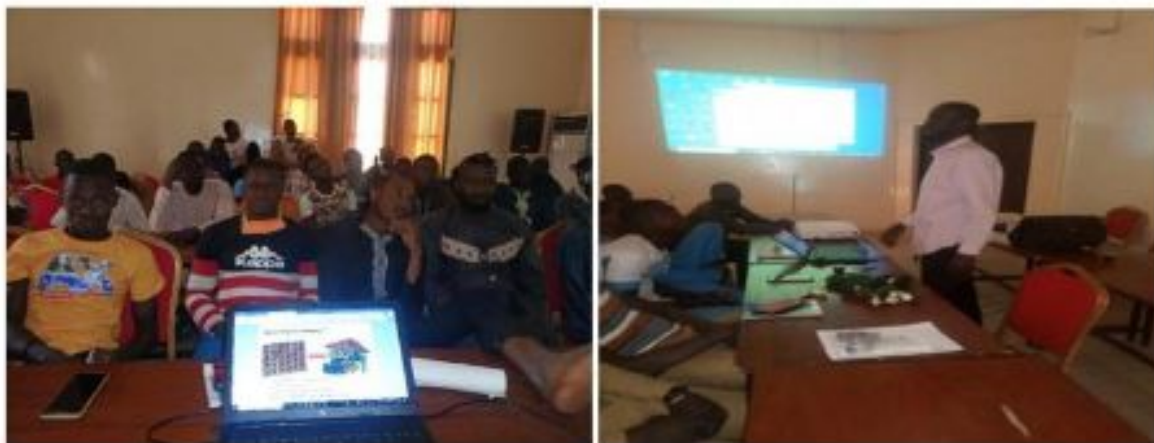
Figure 3: Atelier de formation sur la protection des plantes et la gestion économique

Le CIPMEN (Centre Incubateur des Petites et Moyennes Entreprises du Niger) est une association, ayant pour raison d'être l'accompagnement des entrepreneurs et le développement du secteur entrepreneurial au Niger. Au travers ses moyens d'action, ce dernier assiste les entreprises incubées dans la mobilisation de financement nécessaires tout en fournissant des services de conseils