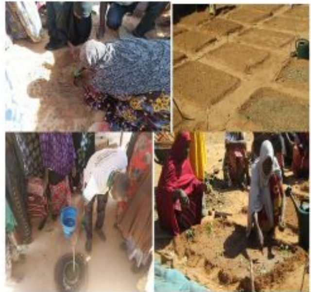
Figure 6: Formation sur les techniques maraîchères du groupement féminin Bonkaney de Saga