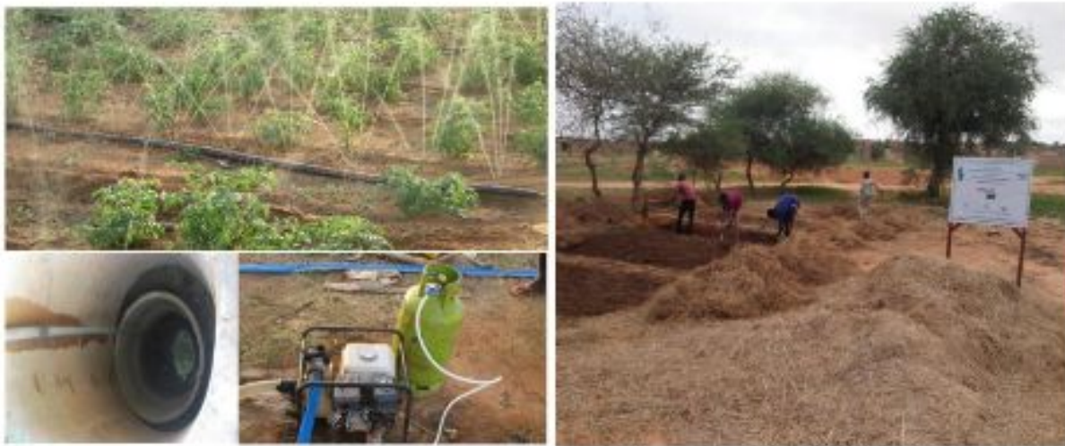
Figure 20: curage du puits et installation d'un système d'irrigation Figure 21: Aire de compostage