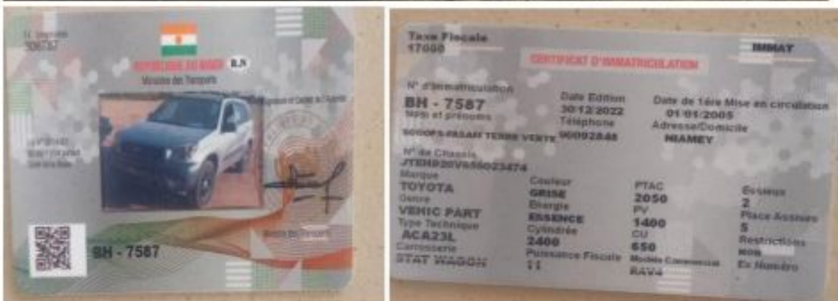
Figure 13: Véhicule 4X4 acquit par la coopérative FASAM