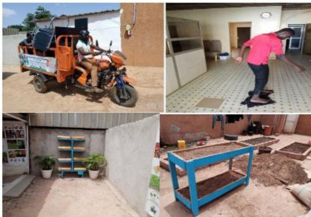
Figure 27: Aménagement du nouveau siège social de FASAM

pièces, d'une salle de formation et d'espaces pour abriter des jardins pédagogiques de formation en agriculture urbaine et d'autres thèmes d'intérêts pour les agents de projets de développement rural.