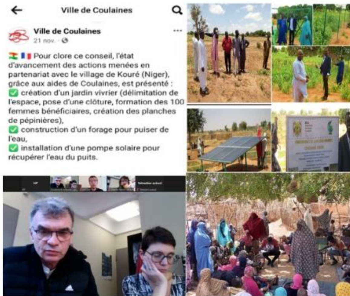
Figure 9: Diagnostics avec les communautés de Tioudawa en présence de la Maire de Kouré

Cette initiative consiste à aménager un jardin vivrier d'une dimension d'un (1) Ha dans le village de Tioudawa. Elle a concerné directement quarante femmes (40) structurées en deux (2) groupements.